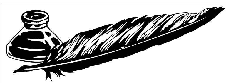
Figur 2: Tegning laget med Adobe Illustrator

Advarsel! Enkelte bruker voldsomt mye tid og krefter på å prøve å tvinge \LaTeX til å plassere en figur eller tabell et fast sted i dokumentet, for eksempel slik at de kan skrive «... som vi ser i følgende figur:». Slikt blir sjelden vellykket! La heller \LaTeX få bestemme hvor flytende figurer og tabeller bør plasseres og bruk kryssreferansemekanismen til å referere til den.